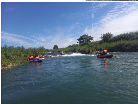
※写真はイメージです

△自然の中で行うアウトドアアクティビティは、常にケガや重大な事故などが発生するリスクを伴います。